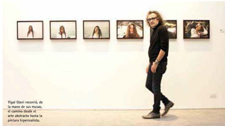
Yigal Ozeri recorrió, de la mano de sus musas, el camino desde el arte abstracto hasta la pintura hiperrealista.

en torno al éxtasis como una pequeña muerte. Ella se introdujo en el agua fría y le estubo haciendo el amor a la naturaleza. Le empecé a decir que quería que fuera como Ofelia y me respondió que no le dé indicaciones, fue hacia el agua e hizo meditación por una hora. Yo espero a que la modelo realice su performance y lo grabo, para ya luego escoger el momento que capturaré.