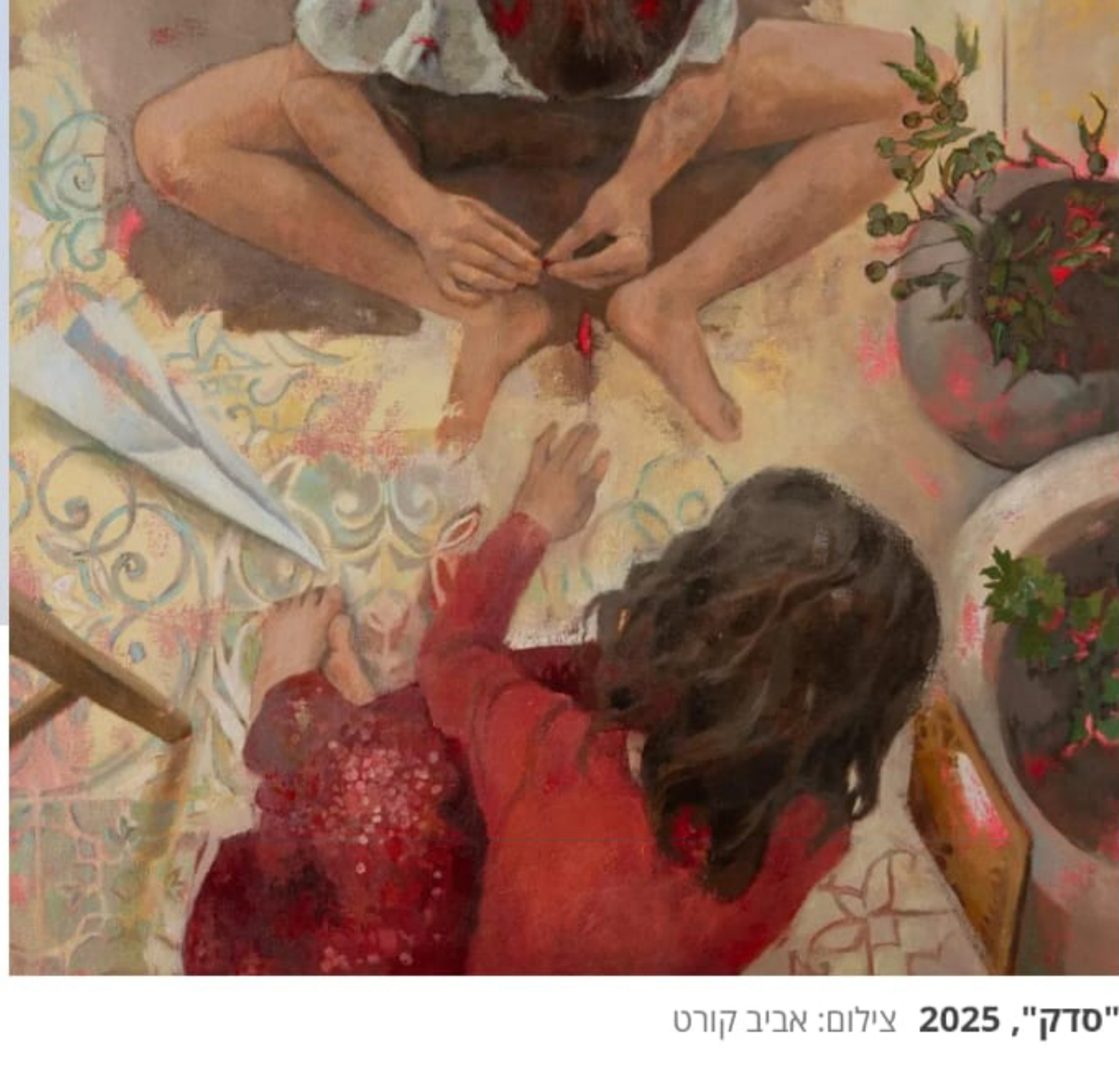
"סדק", 2025