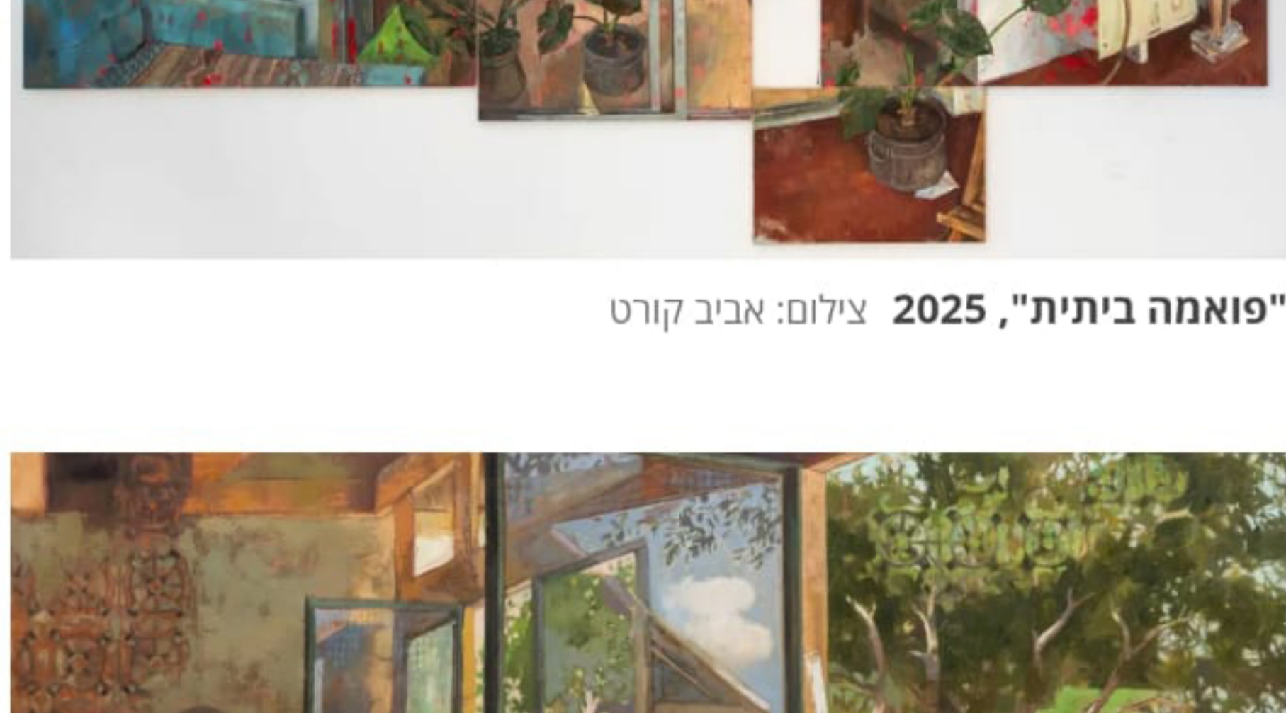
"פואמה ביתית", 2025