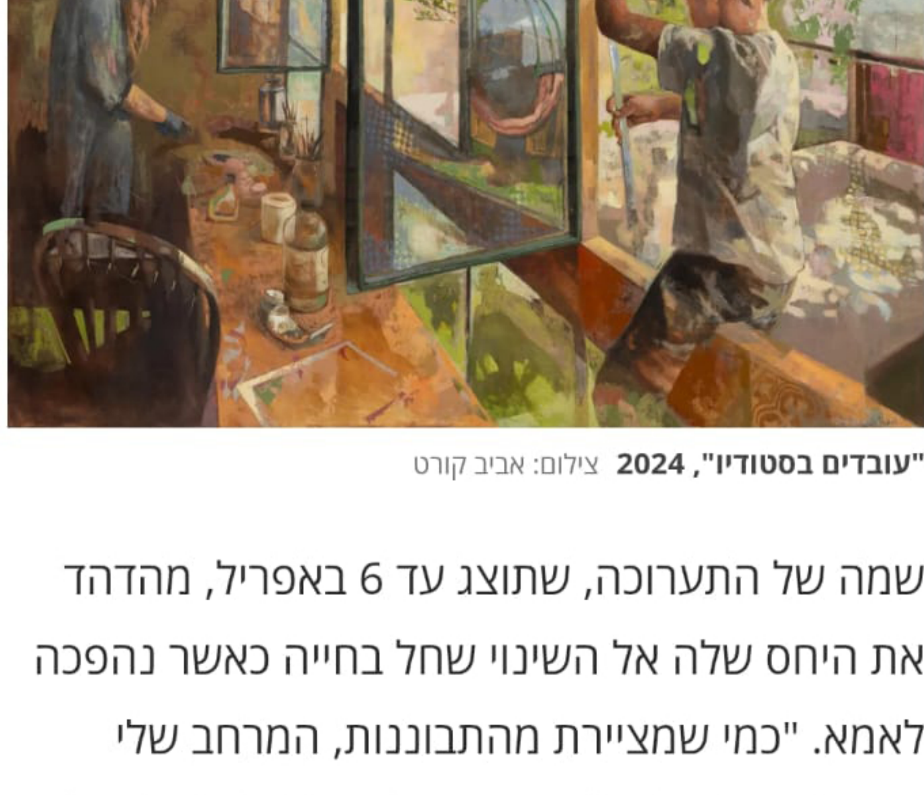
"עובדים בסטודיו", 2024

שמה של התערוכה, שתוצג עד 6 באפריל, מזהה את היחס שלה אל השינוי שחל בחייה כאשר נהפכה לאמא. "כמי שמציירת מהתבוננות, המרחב שלי השתנה. יש סביבי פתאום כל מיני חפצים ומשחקים ומטוסים מנייר, שמצד אחד הופכים להיות חלק מהמרחב שלי וממי שאני, ומצד שני, מציגים איזה דיסוננס ביחס לחיים הקודמים שלי", היא אומרת.