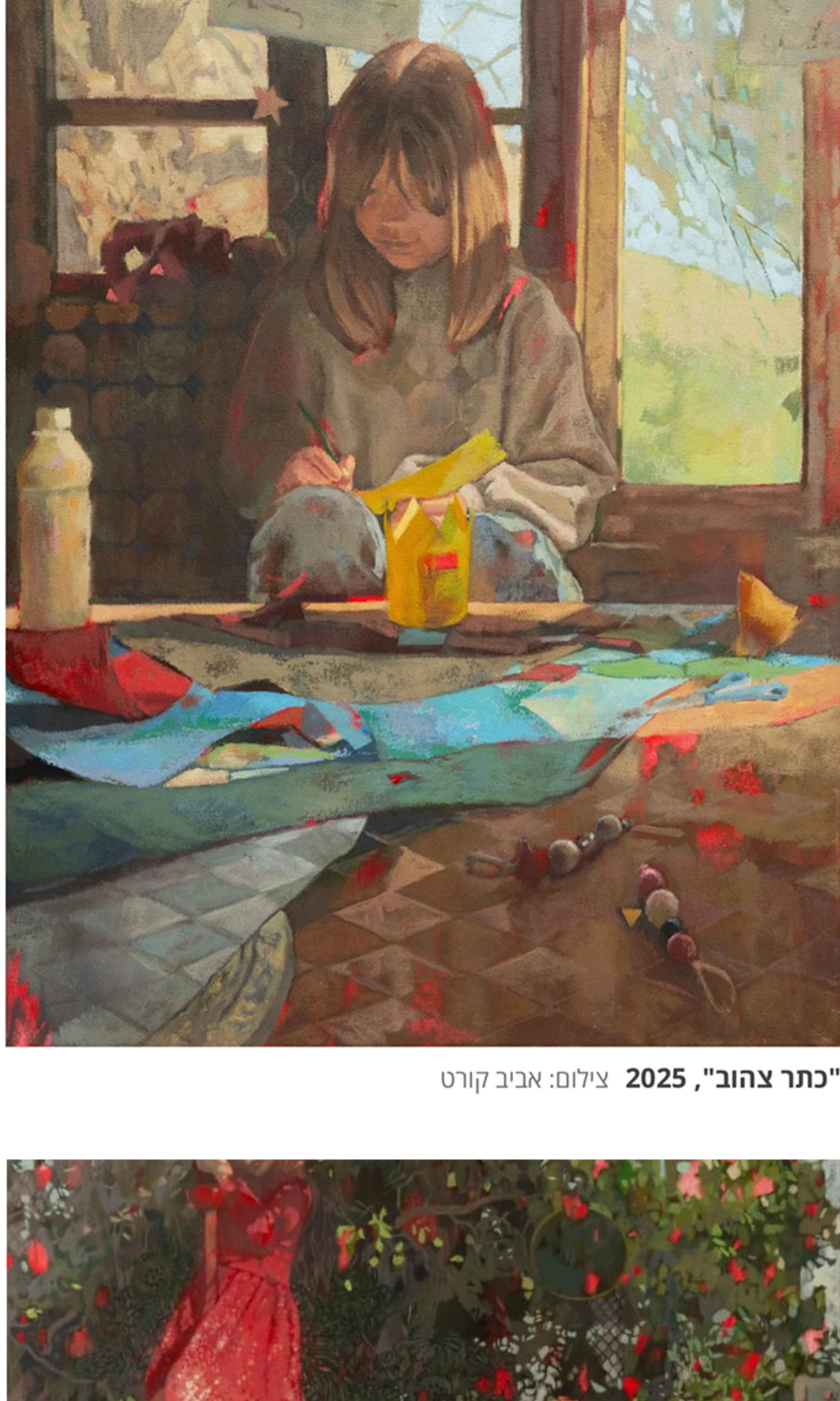
"כתר צהוב", 2025

בעבודותיה מתארת יעל דרריזין רבו את המרחב הביתי שלה. בחמש השנים האחרונות, מאז נולד בנה הבכור, נוספו לו גם חרוזים, חישוקי משחק, גזירי נייר, מכוניות צעצוע ושלל חפצים צבעוניים. מי שמפעילים את האובייקטים הללו הם בנה וחבריו, הגיבורים של ציורי השמן שלה. הם מכינים כתר מקרטון, מטפסים על עץ, רושמים משהו בריכוז, משחקים בחצר, ממיינים מיני דברים, מגלפים בעץ, בוכים, מצוירים או משוחחים ביניהם.